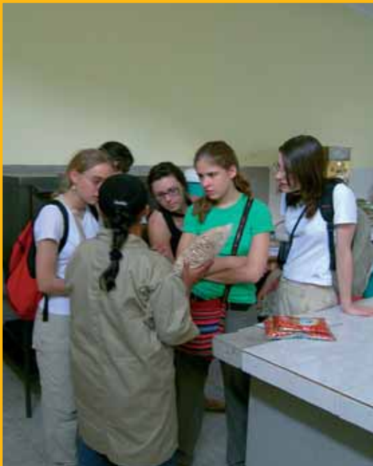
Explications sur le traitement de l'amaranto céréale ancestrale des Andes (usine de Coraca Irupana)