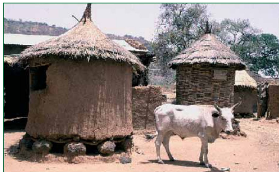
Cases de stockage de céréales au Burkina Faso

DAKUPA est un collectif de 38 organisations communautaires de base, comptant un total d'environ 1900 membres: des agriculteurs, des éleveurs et des associations socio-professionnelles qui travaillent dans la province du Boulgou au Burkina Faso. L'association est née en 1993 de par la volonté d'une dizaine de groupements villageois de se doter d'une structure paysanne propre qui puisse répondre à leurs questions de développement. DAKUPA est un partenaire de Frères des Hommes Europe depuis six ans.