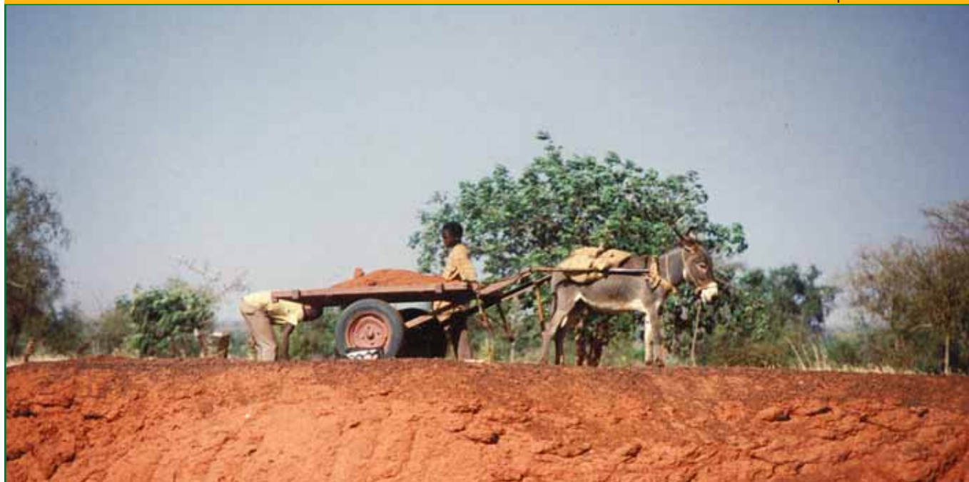
Travail dans les champs au Burkina Faso.

Ce projet a été réalisé avec le soutien financier de la Ville du Luxembourg, du Bazar International et de l'ONG Jongbaueren a Jongwënzer.