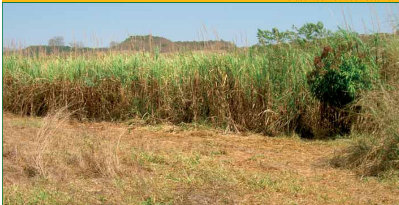
Plantation de canne à sucre à Goiás-Brésil.