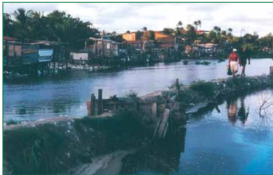
Elevage de crevettes dans la mangrove de la favela de Caranguejo/Tabaiaras

Le CJC (Centre Josué de Castro) a été créé dans les années 70 et travaille dans les favelas de la ville de Recife. Le travail de CJC se concentre sur l'amélioration du travail et des revenus dans les favelas pour améliorer les conditions de vie de la population. Le CJC s'investit dans la formation des ressources humaines de la communauté pour renforcer l'organisation économique et politique des petits entrepreneurs/euses.