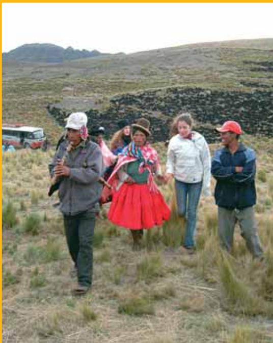
L'accueil de la communauté de Huari Pucara (4.000 m.)