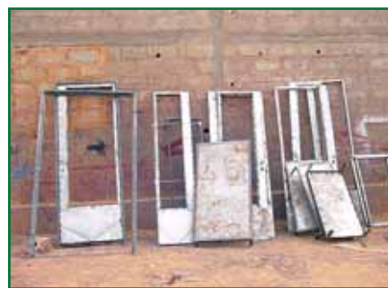
Atelier de menuiserie métallique, Ségou.

Ce projet a été réalisé avec le soutien financier de la Ville de Luxembourg et de la Ville d'Ettelbruck