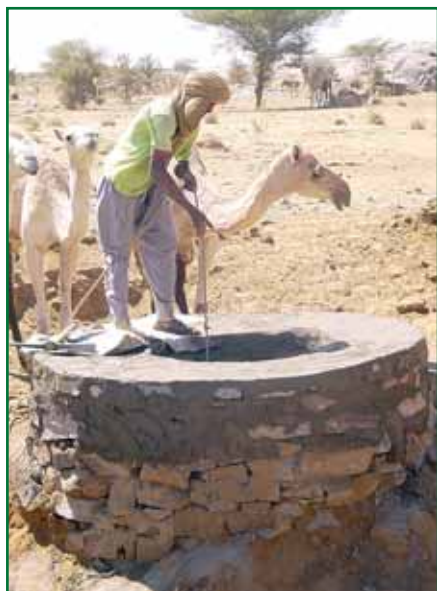
Puits dans le désert, Mali.

Pendant la mission effectuée en novembre 2004, la responsable Afrique de Frères des Hommes a pu constater les réalisations du projet. L'école du village d'Amezerakad est réalisée et fonctionnelle. Deux instituteurs se partagent deux classes de cinq niveaux.